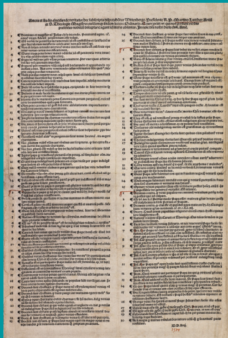
95 Thesen Martinus Lutheri, 31. Juli 1517

Wie een aflaat kocht, hoopte aan het vagevuur te ontsnappen. Door dit systeem in vraag te stellen ondergroef Luther het gezag van de paus en zaaide hij twijfel over de verering van heiligen en relikven. De kerk zag haar bron van inkomsten bedreigd.