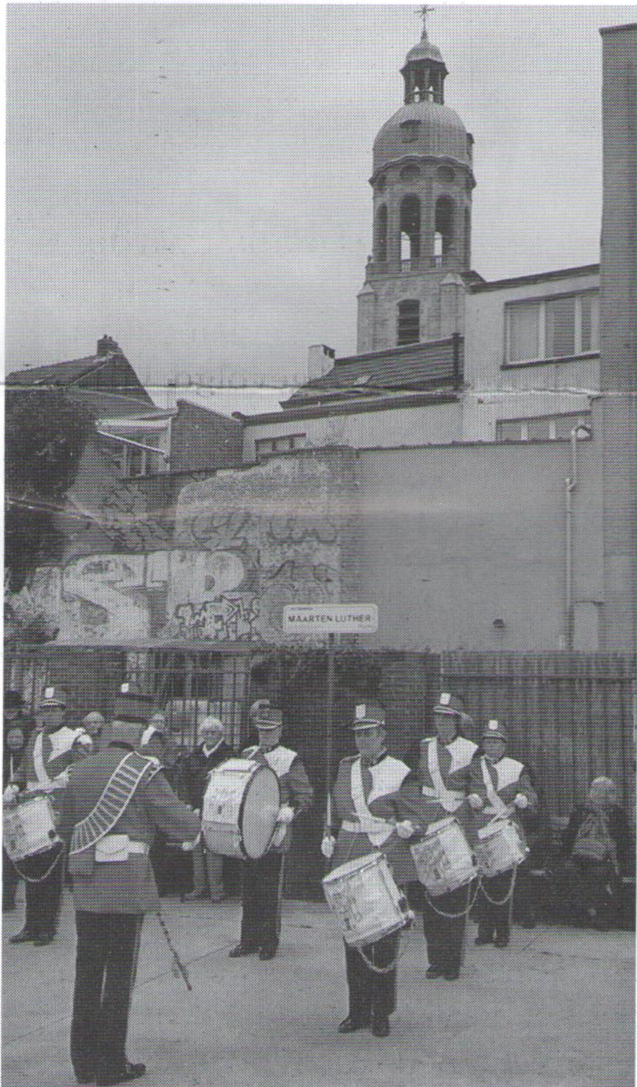
De Stadstrommelaars geven van katoen