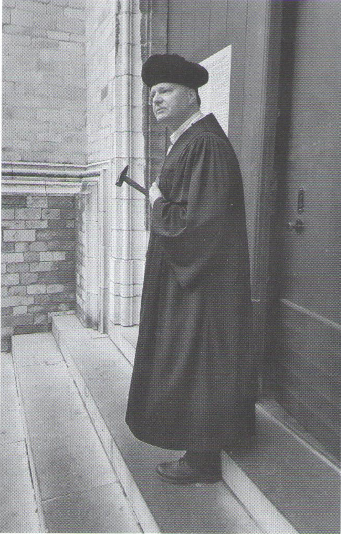
Evocatie van Luther voor de kerkdeur van Wittenberg