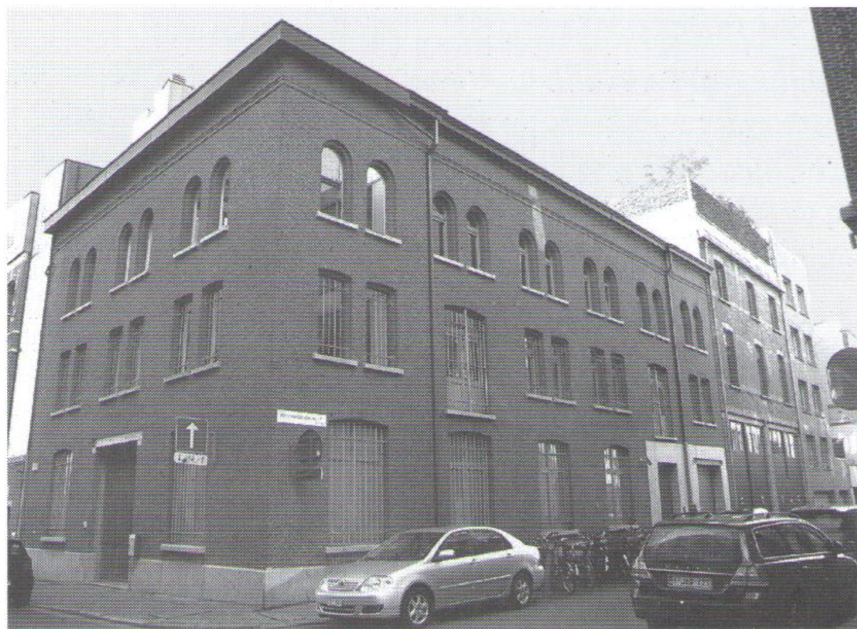
Hoekhuis Mabesoone op nummer 3